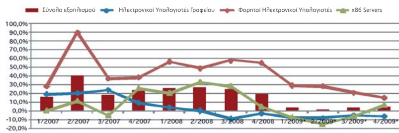
Διάγραμμα 1. Ρυθμός ανάπτυξης Δαπανών Λογισμικού στην Ελλάδα, *Πρόβλεψη, Πηγή: IDC, 2008