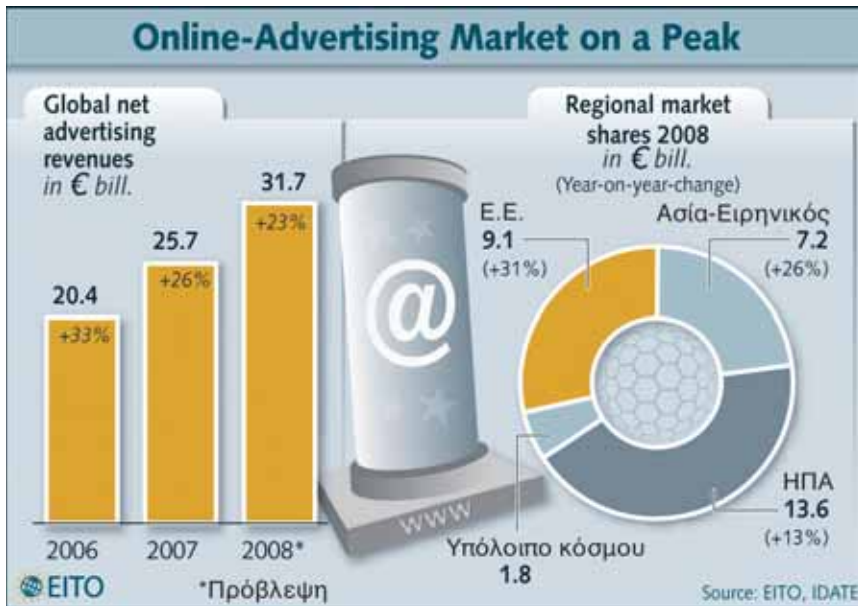
Διάγραμμα 2. Παγκόσμια αγορά online διαφήμισης, Πηγή: EITO, DATE, 2008

Διεθνώς η διαφήμιση μέσω του Διαδικτύου αναπτύσσεται με ρυθμό της τάξης του 23%, αγγίζοντας τα €31,7 δις και μάλιστα η Ευρώπη δείχνει να αγγίζει τις επιδόσεις των Ηνωμένων Πολιτειών